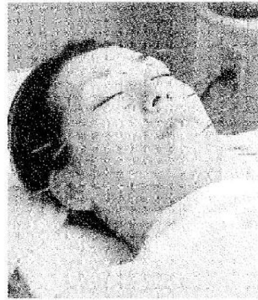
写真3 顔面に刺鍼後、 置鍼15分

鍼は長さ3cm、径が0.12mmのものを 사용합니다。中国、韓国では一般的ではありませんが、鍼管を使う日本鍼を使います。顔に25本前後刺していきます。刺鍼の時間は20分ほどです。置鍼は15分（写真3）。